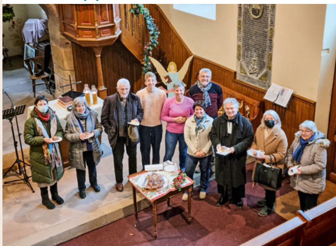
Le partage de la galette des rois a eu lieu après le culte de l'Épiphanie du 11 janvier.