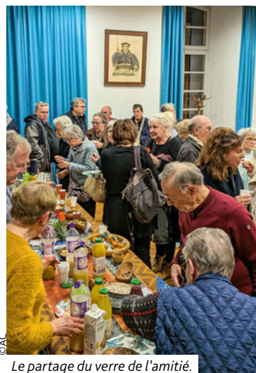
Le partage du verre de l'amitié.

La Journée mondiale de prière a réuni des paroissiens des communautés catholique, protestante et évangélique, le vendredi 6 mars dernier à la Salle Schweitzer de l'église protestante de Brumath. Cette année le Nigéria était à l'honneur, et la cérémonie avait été préparée par un groupe de femmes chrétiennes nigérianes et portée par des bénévoles de nos paroisses. Après le temps