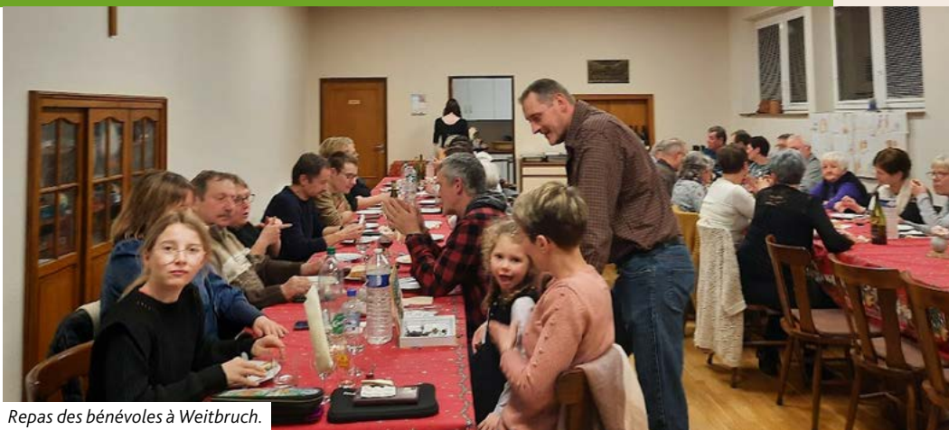
Repas des bénévoles à Weitbruch.

Les multiples échanges qui ont eu lieu à cette occasion ont permis de renforcer les liens existants ; de quoi envisager sereinement l'édition 2024 de la fête qui est prévue le 1 er décembre prochain au Millénium à Weitbruch !