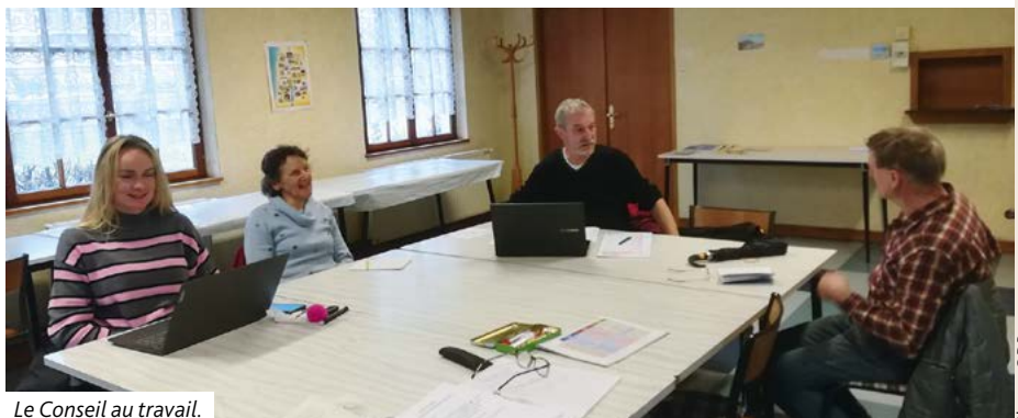
Le Conseil au travail.