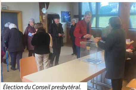
Élection du Conseil presbytéral.