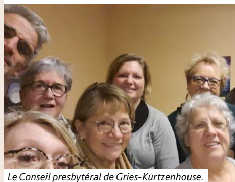
Le Conseil presbytéral de Gries-Kurtzenhouse.