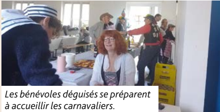
Les bénévoles déguisés se préparent à accueillir les carnavaliers.