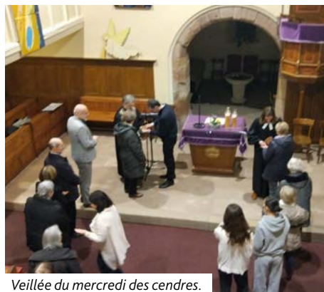
Veillée du mercredi des cendres.

Le 14 février a eu lieu une veillée du mercredi des cendres. Le temps du Carême a ainsi débuté par un culte consistorial qui a permis de se retrouver autour du thème « Chemin de Carême, chemin de vie »