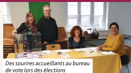
Des sourires accueillants au bureau de vote lors des élections

Félicitations à chacun et chacune. Merci aux conseillers et conseillères pour leur engagement dans ce ministère. Et merci aux votants pour leur soutien !