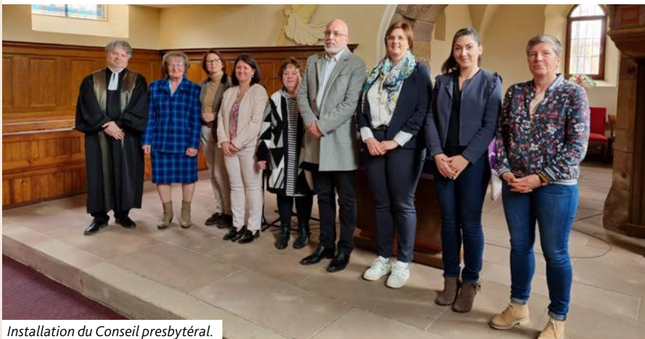
Installation du Conseil presbytéral.