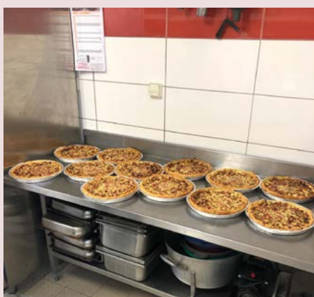
Souvenir de l'édition 2023 : les tartes à la rhubarbe prêtes à être dégustées.

ultérieurement, le jeudi au secrétariat de la paroisse et sur facebook (voir l'entête de la page X).