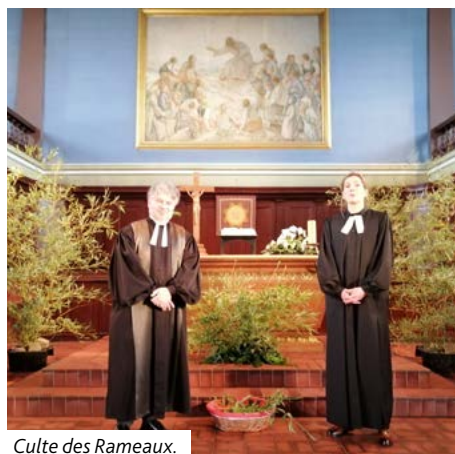
Culte des Rameaux.

Jeu de l'Ascension, le 9 mai, fête paroissiale: culte à l'église à 10h15 et repas convivial à la salle paroissiale. Cordiale invitation à tous.