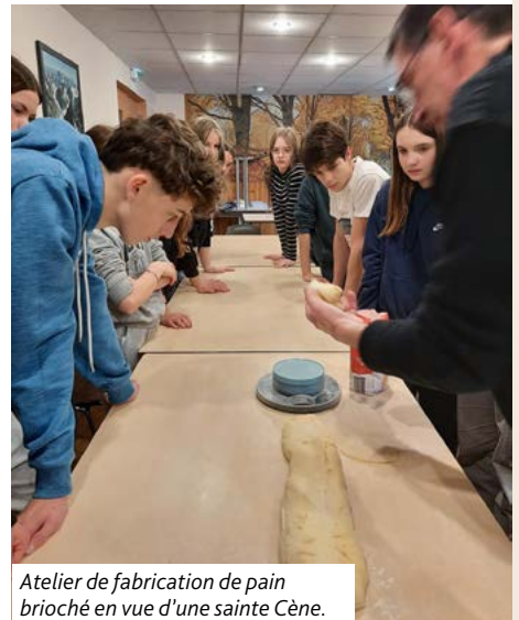
Atelier de fabrication de pain brioché en vue d'une sainte Cène.