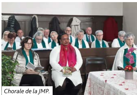
Chorale de la JMP.