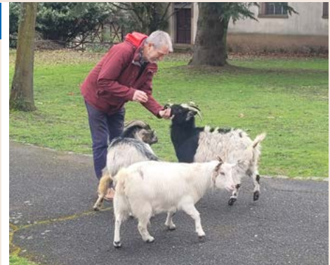
Les chèvres dans le parc de l'église de Geuderthheim.

« Apprends à bien connaître Dieu, à le servir d'un cœur dévoué et d'un esprit bien disposé, car l'Éternel regarde jusqu'au fond des cœurs et il discerne toutes nos intentions. Si tu le cherches, il se laissera trouver par toi. Mais si tu l'abandonnes, il te rejettera pour toujours. Paroles de David à son fils Salomon » (1 Chroniques 28, 9).