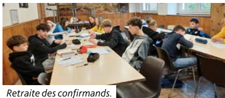
Retraite des confirmands.