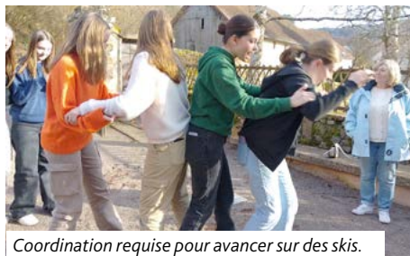
Coordination requise pour avancer sur des skis.

Les jeunes de Hoerd-Weyersheim, de Geudertheim sont partis en retraite à Fouday avec les jeunes de Gries-Kurtzenhouse et de Weitbruch. Souvenirs... Pour plus de photos, rendez-vous sur les pages de Gries-Kurtzenhouse et Weitbruch.