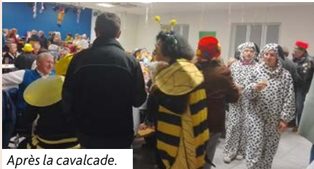
Après la cavalcade.